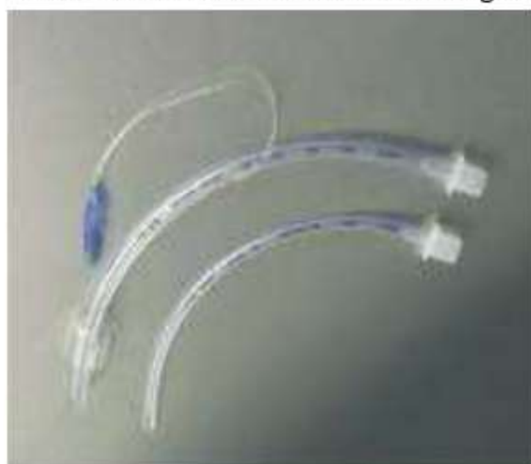
TUBO ENDOTRAQUEAL CON Y SIN BALÓN

OBSERVACIONES: Descartar luego de usar, No usar si el paquete esta abierto o dañado (producto desechable). Vida útil: 5 años.